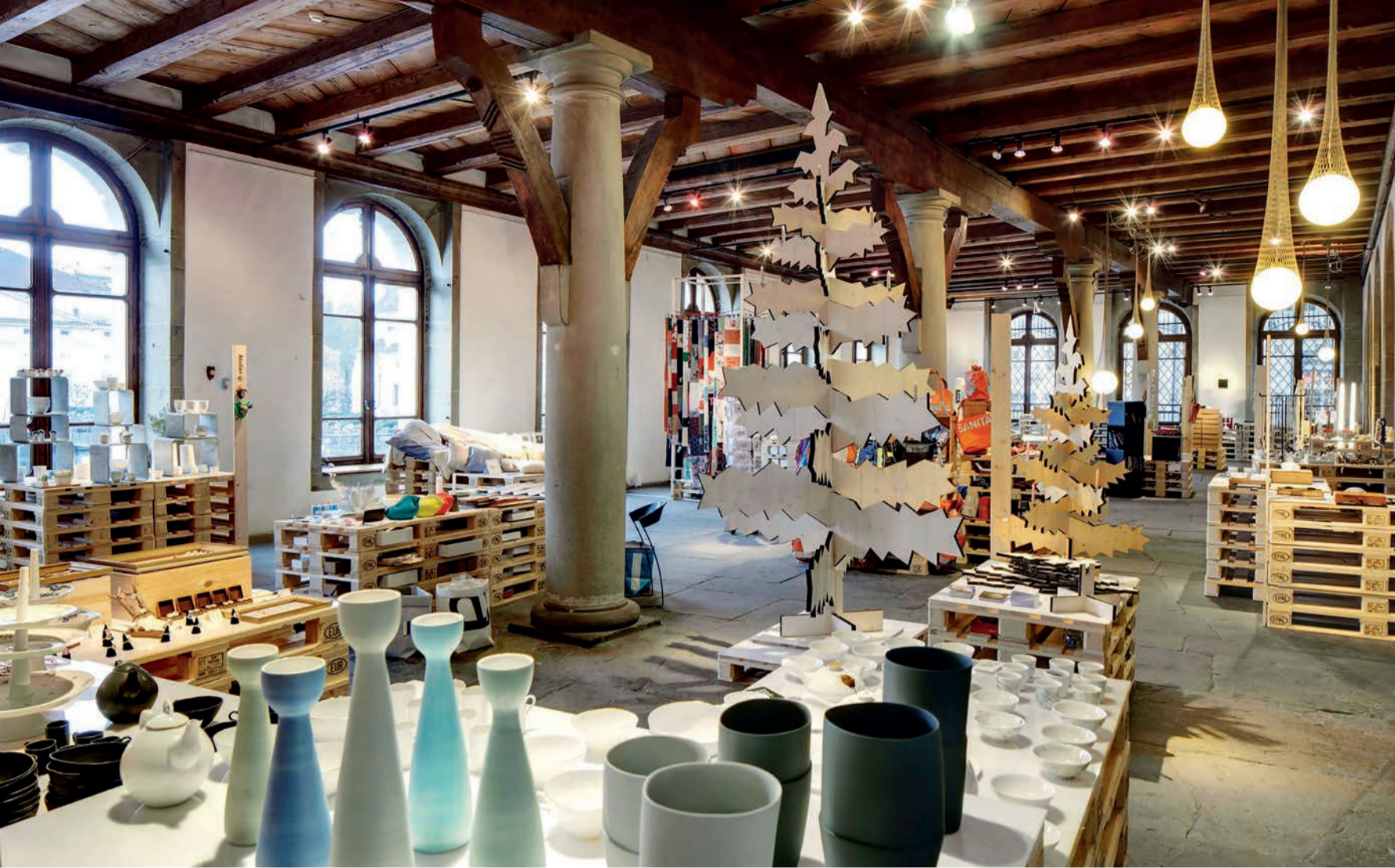
Statt einzelne Stände findet man an der DesignSchenken Paletten, auf denen die diversen Produkte präsentiert werden, hier in der Kornschütte.