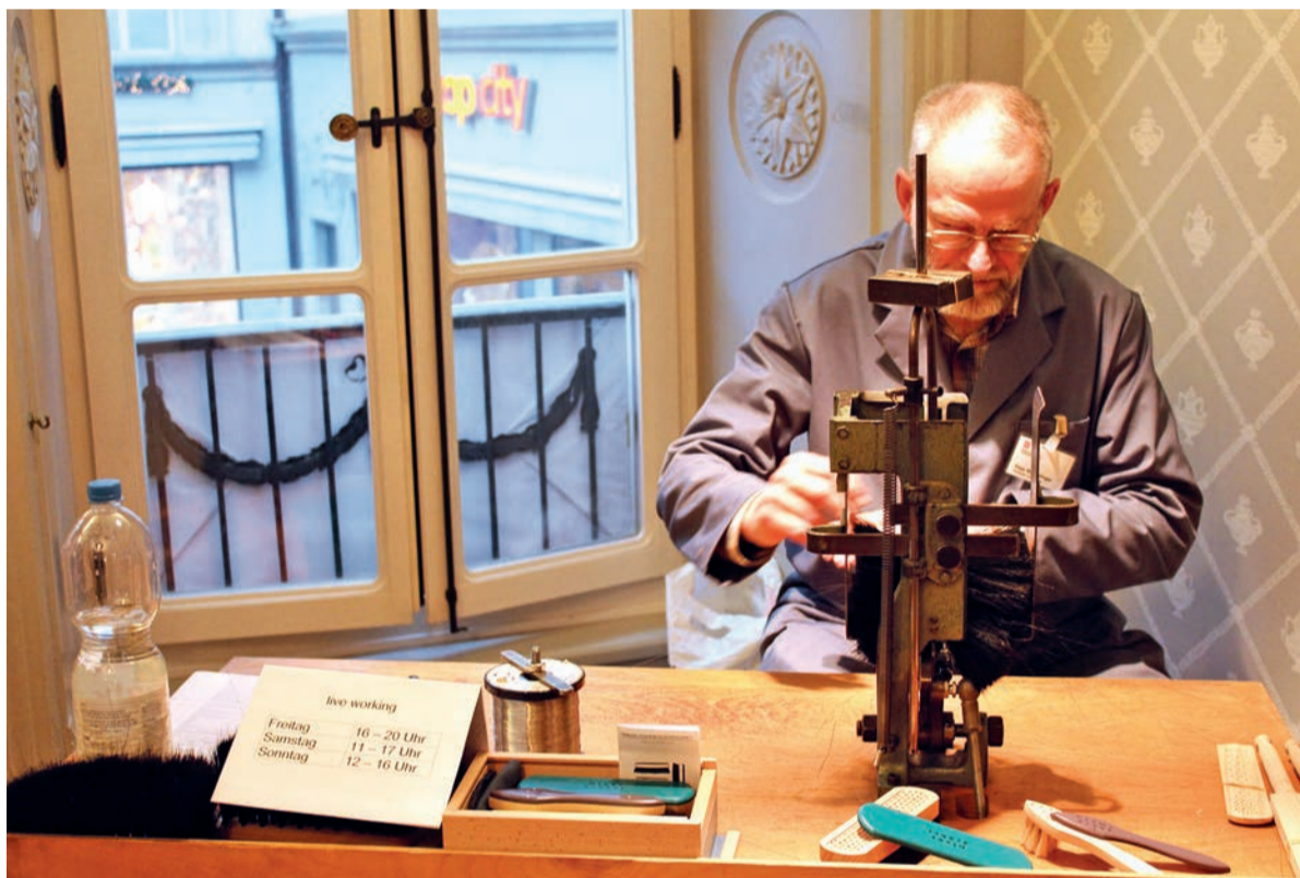
Eine Impression aus dem letzten Jahr: Live-Working bei Götti + Niederer.

ISBN 978-3-03774-068-2 Preis: Fr. 49.00 www.9mal9.ch